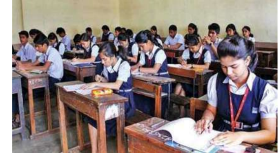
जिले में कुल 22 संवेदनशील परीक्षा केंद्र हैं। किसी भी केंद्र से किसी प्रकार कोई अनुचित घटना सामने नहीं आयी है। बता दें कि, सरकार ने नकलमुक्त अभियान के तहत टोल फ्री क्रमांक 112 जारी किया है। जिले में कक्षा दसवीं एवं बारहवीं के पेपर

भंडारा : महाराष्ट्र राज्य माध्यमिक बोर्ड की कक्षा दसवीं की परीक्षा शुक्रवार, 21 फरवरी से शुरू हुई है। परीक्षा के पहले दिन मराठी का पर्ये में कुल 142 छात्र-छात्राएं अनुपस्थित रहे। जिले के कुल 88 परीक्षा केंद्रों पर कुल 14 हजार 745 छात्र-छात्राओं ने पंजीयन किया था। जिसमें से कुल 14 हजार, 603 छात्र-छात्राओं ने पहला पर्या दिया, जबकि 142 छात्र-छात्राएं अनुपस्थित थे। इस दौरान सभी परीक्षा केंद्रों पर जिला प्रशासन तथा पुलिस प्रशासन की कड़ी नजर रही।