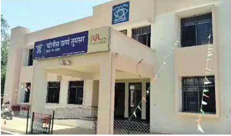
दिए जाने वाले थे। इस मामले की जांच के पश्चात गुजरात पुलिस की टीम तुमसर पहुंची है। इतनी बड़ी राशि युवक के खाते में जमा कराने के पीछे के कारणों का पता लगाने के लिए गांधीनगर की पुलिस टीम संबंधित युवक को अपने साथ ले गई है। तुमसर के युवक के खाते में इतनी बड़ी राशि

गोंदिया : कृषि उपज बेचते समय धोखाधड़ी को रोकने के लिए सरकार समर्थन मूल्य पर धान खरीदती है। लेकिन, धान खरीदी प्रक्रिया में केंद्र पर कई अनियमितताओं और लूट को देखते हुए, जिले के आधे से अधिक किसान इस विश्वास के साथ अपनी कृषि उपज बेच रहे हैं कि व्यापारियों का मूल्य समर्थन मूल्य से बेहतर है। गोंदिया जिले में 1 लाख 86 हजार 578 से अधिक किसानों ने कृषि उपज बेचने के लिए सरकारी पोर्टल पर पंजीकरण कराया है। लेकिन, उनमें से 87,000 किसानों ने समर्थन मूल्य से मुंह मोड़ लिया है। गोंदिया जिले में सबसे ज्यादा धान का उत्पादन है। इस जिले में खरीफ सीजन के दौरान 2 लाख हेक्टेयर से अधिक भूमि पर खेती होती है, जिसके अनुसार, खरीफ सीजन से अपेक्षित उत्पादन लगभग 80 लाख क्विंटल है, जिसमें से किसान कुल उत्पादन का औसतन लगभग 60 लाख क्विंटल बेचते हैं। सरकार सामान्य गुणवत्ता वाला धान 2,300 रु. प्रति क्विंटल और ए-ग्रेड धान 2,320 रु. प्रति क्विंटल की दर से खरीदती है। गोंदिया जिले में 1 लाख 86 हजार 578 किसानों ने धान बेचने के लिए सरकारी पोर्टल पर पंजीकरण कराया है। आदिवासी विकास महामंडल ने 22 हजार किसानों से धान खरीदा है।