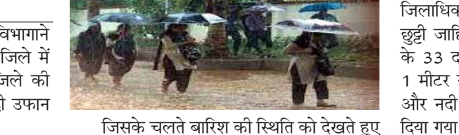
जिसके चलते बारिश की स्थिति को देखते हुए

भंडारा : भंडारा जिला हवामान विभागाने बारिश का रेड अलर्ट दिया है। दिनों से जिले में मुसालधार बारिश हो रही है। तो वही जिले की जीवनदायनी कही जाने वाली वैनगंगा नदी उफान पर बह रही है।